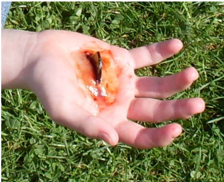
Obrázek XY – Cizí těleso v ráně.