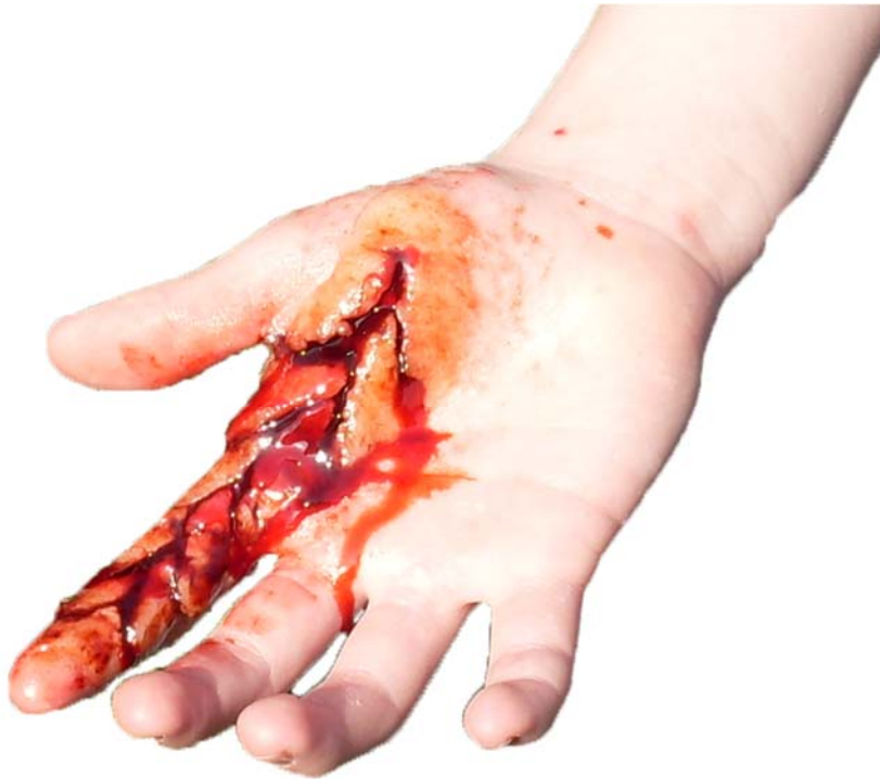
Obrázek XY – Tržná rána.

Pokud potřebujete do rány cizí těleso (střep), vezměte plastový střep a „zapíchněte“ jej do rány.